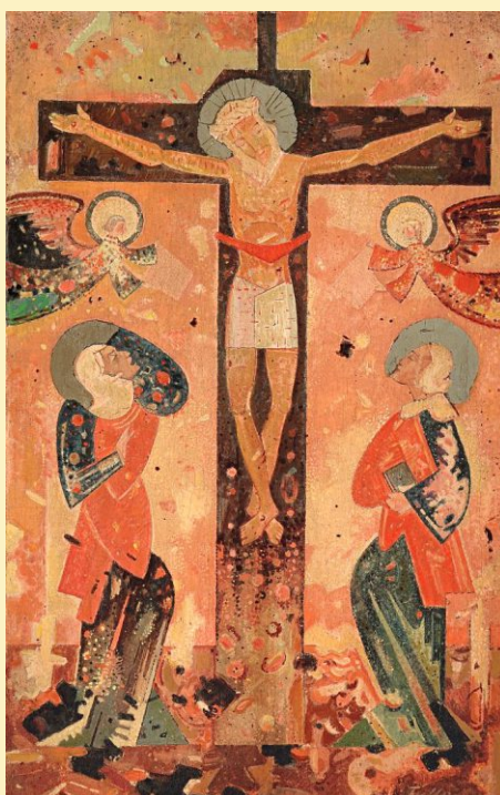
Ukrižovanie, Ľudovít Fulla