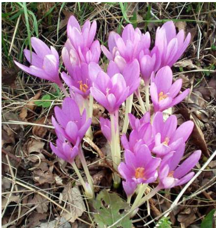
JESIENKA OBYČAJNÁ / colchicum autumnale/.

končiace leto, začínajúca jeseň a pri prechádzke po okolí obce ste si určite všimli bledofialové kvety, ktoré rastú na vlhkých miestach na okraji lúk a pasienok. Je to JESIENKA OBYČAJNÁ / colchicum autumnale/. Je síce krásna, ale jedovatá. Z podzemnej hlúze na jeseň vyrastajú kvety, ktoré nemajú listy, tie vyrastú na jar, s veľkou tobolkou obsahujúcou semená, ktoré sa rozširujú po okolí - a celý cyklus rastu sa opakuje.