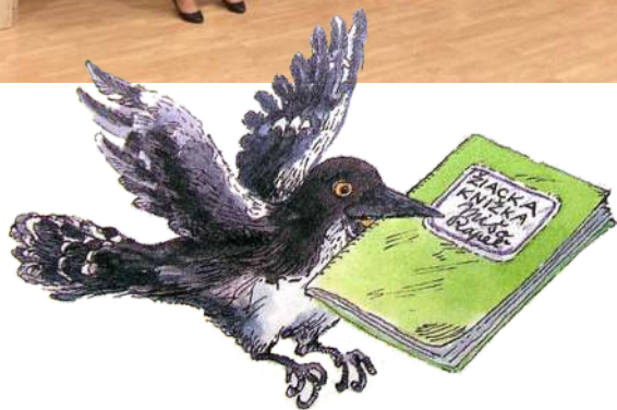
Termíny školských prázdnín v školskom roku 2022/2023