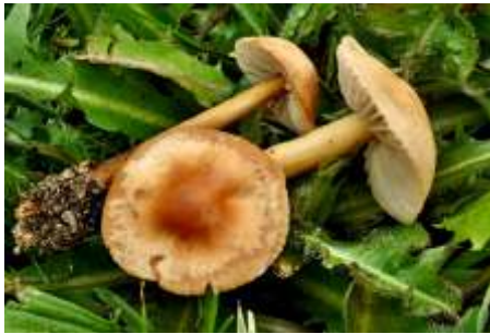
Tanečnica Poľná / Marasmius oreades

Na lúkach, zvlášť po daždi, môžeme nájsť rásť tanečnicu poľnú, ktorá sa veľmi ľahko zbiera a je výborná na polievku, do omáčok a na sušenie. Zbierame len klobúčiky, hlúbiky sú tvrdé.