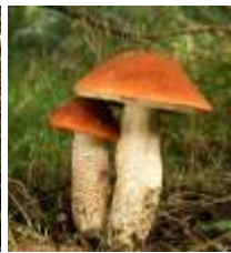
Kozák osikový / Leccinum rufum