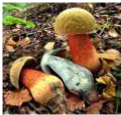
Hríb siný / Boletus luridus

Prvý z hríbovitých húb začína rásť „modrák“ – hríb siný. Treba ho dobre tepelne upraviť, jeho chuť vynikne hlavne sušením. Rastie hojne v listnatých aj ihličnatých lesoch. Pod hrabmi možno nájsť kozák hrabový (ľudovo pincel) v osičkách kozák osikový (červenák), ktoré sú vhodné na akúkoľvek kuchynskú úpravu. V júni začínajú rásť asi najobľúbenejšie z húb – kuriatka jedlé – vhodné na zaváranie, praženie aj sušenie. Sušené dajú vynikajúcu chuť zvlášť hovädzej polievke. Treba skúsiť!