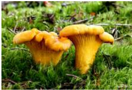
Kuriatko jedlé / Cantharellus cibarius