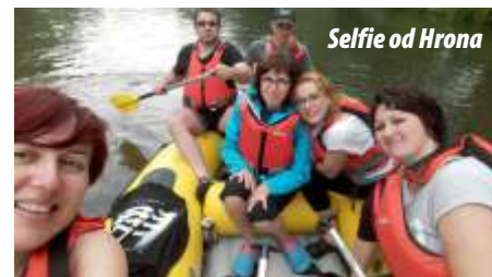
Selfie od Hrona