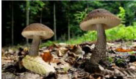
Kozák hrabový / Leccinum griseum