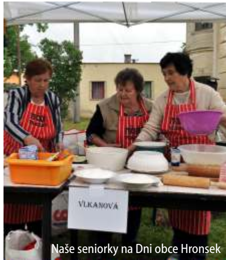
Naše seniorky na Dni obce Hronsek