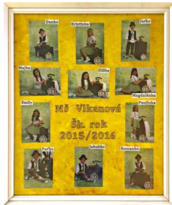
Naši budúci školáci